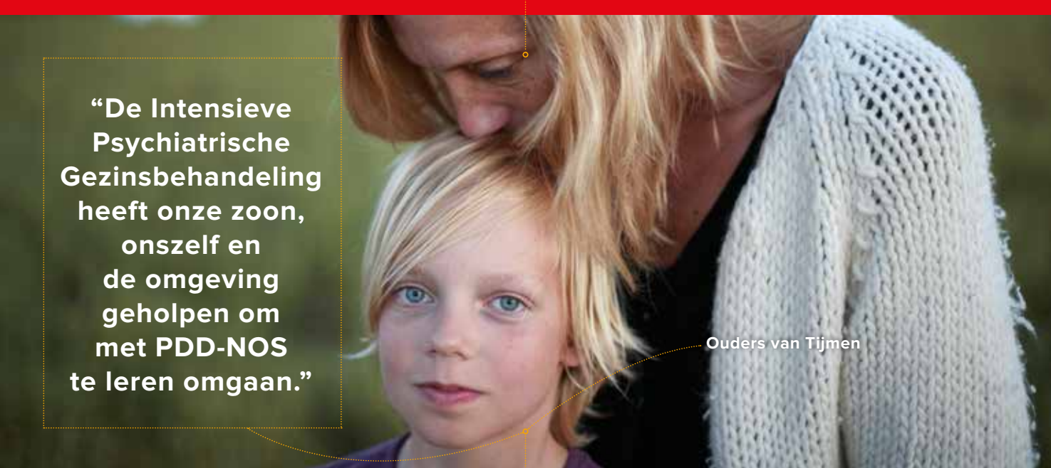
Ouders van Tijmen

Bij de behandeling kijken wij altijd goed naar wat uw kind nodig heeft en wat het beste bij uw kind past. Dit bespreken we samen met u en uw kind. Dit kunnen therapieën of gesprekken zijn, individueel, in een groep, of met de ouders erbij. Ook combineren we dit met online behandeling (eHealth). Soms worden er medicijnen voorgeschreven en soms is een tijdelijk klinisch verblijf bij Karakter nodig om weer verder te kunnen. Onze zorg is erop gericht om uw kind zoveel mogelijk in de eigen omgeving te begeleiden en straks zo goed mogelijk te laten meedoen in de maatschappij.